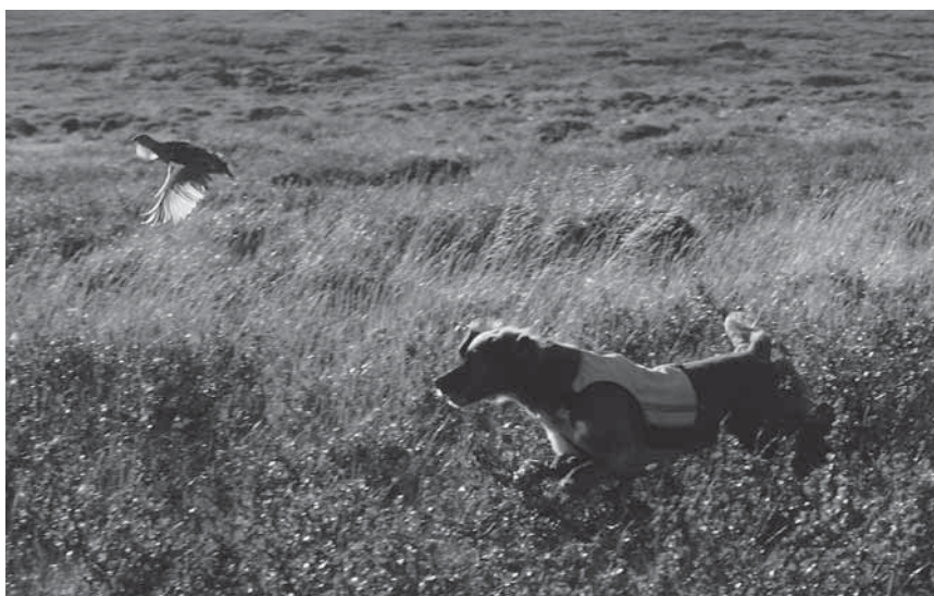
Tämä ei ollut onneksi tulokseton seisonta.